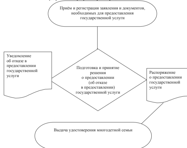
Приложение № 4

Блок-схема предоставления территориальными органами Министерства здравоохранения, семьи и социального благополучия Ульяновской области государственной услуги по регистрации многодетных семей